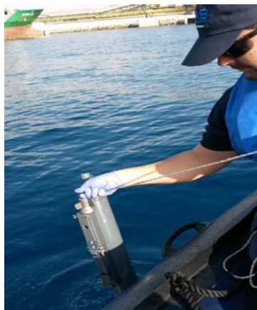
Toma de muestras de agua con botella oceanográfica (muestras integradas)

A continuación se muestran algunas fotografías tomadas durante la toma de muestras y medidas in situ .