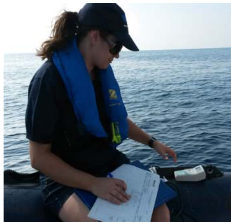
Toma de datos in situ

Las muestras integradas en profundidad se han tomado a partir de la mezcla de las siguientes alícuotas: