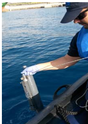
Toma de muestras con botella oceanográfica (muestras integradas)

Se han medido in situ las variables pH, conductividad, temperatura, oxígeno disuelto y porcentaje de saturación de oxígeno en el lugar y momento de la toma de muestras de agua. A continuación se muestran algunas fotografías tomadas durante la toma de muestras y medidas in situ .