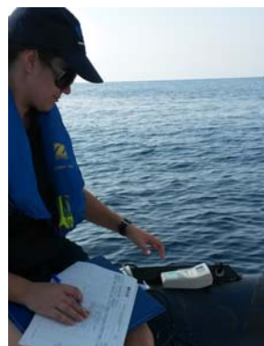
Toma de datos in situ