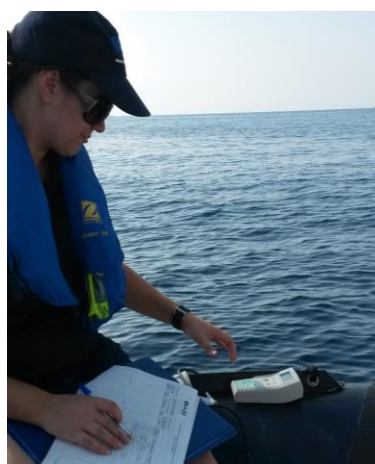
Toma de datos in situ

Para llevar a cabo los análisis de las aguas se han tenido en cuenta las normas internacionales publicadas para el análisis de cada contaminante (Normas ISO), así como lo establecido en el Anexo III del Real Decreto 817/2015.