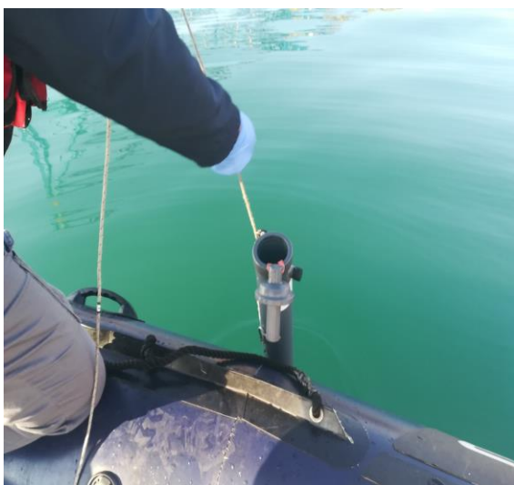
Toma de muestras de agua con botella oceanográfica (muestras integradas)

A continuación se muestran algunas fotografías tomadas durante la toma de muestras y medidas in situ .