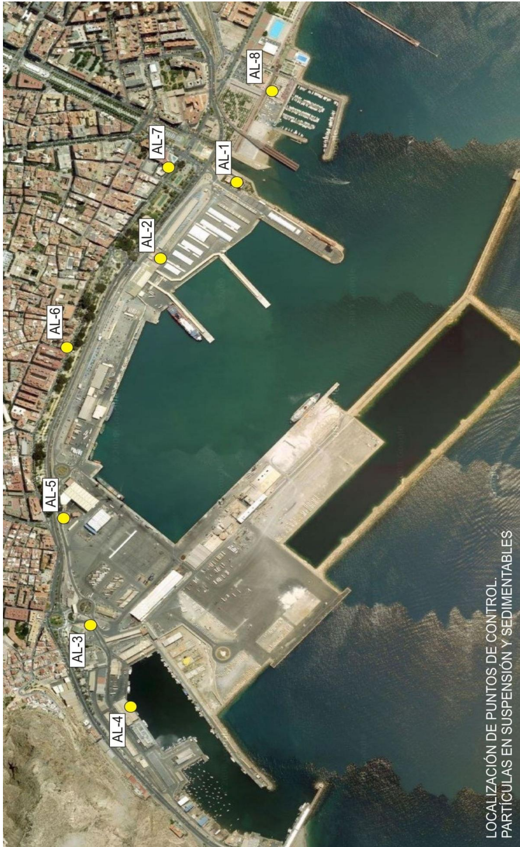
LOCALIZACIÓN DE PUNTOS DE CONTROL. PARTÍCULAS EN SUSPENSIÓN Y SEDIMENTABLES