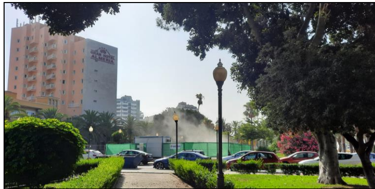
Imagen 1. Partículas en suspensión provocadas por la obra.

-02/07/2021: Se realizan unas obras frente al Instituto Social de la Marina que provocan gran cantidad de partículas en suspensión.